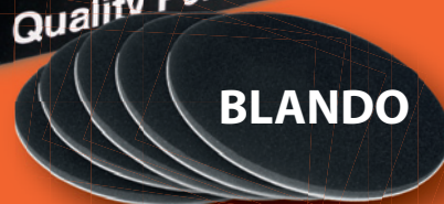
Perfect Finish Pad blando 6.8215.0150