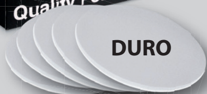
Perfect Finish Pad duro 6.8205.0150