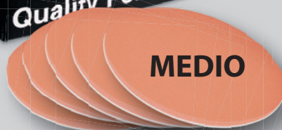
Perfect Finish Pad medio 6.8210.0150